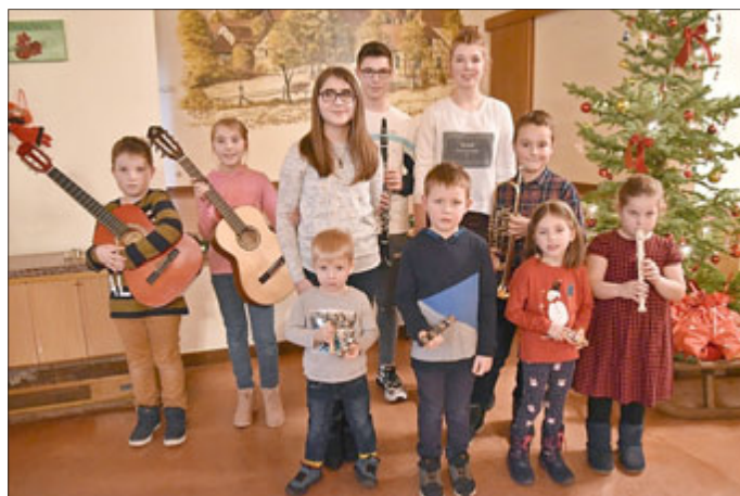
Die talentierten Nachwuchsmusikanten erfreuten die Senioren von Schierschwende.