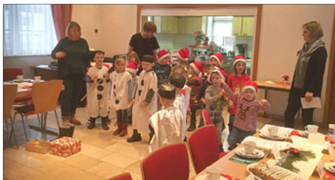
Text und Bilder Volker Meyer