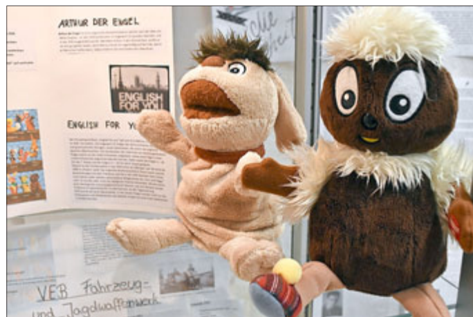
Figuren aus dem Kinderfernsehen der DDR.