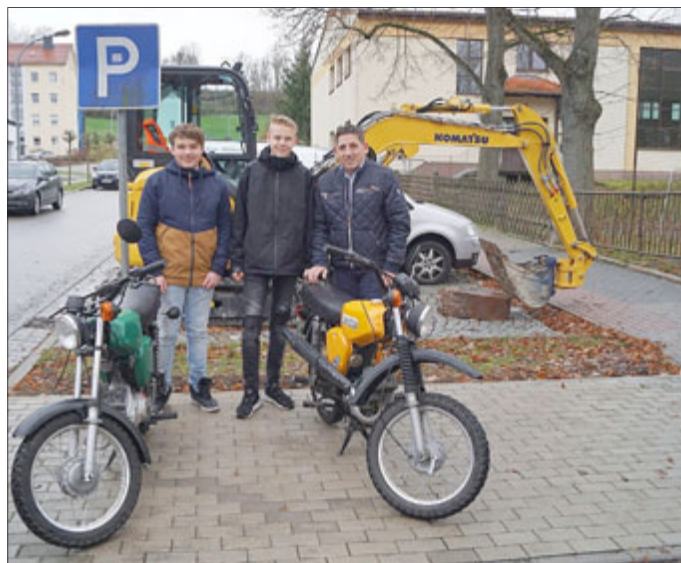
Text und Bild: Heidi Zengerling

Es ist geplant, mit einem Grünstreifen den Mopedstellplatz von den Parkplätzen oberhalb abzugrenzen. Außerdem wird ein Schild angebracht, welches die Fläche als Mopedstellplatz kenntlich macht.